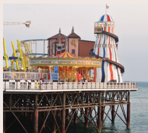
Brighton, The Pier

Jour 1 : traversée en Eurotunnel puis route vers Brighton , célèbre station balnéaire de la côte anglaise. Visite du Sea Life Centre . C'est sous les voûtes victoriennes que vous