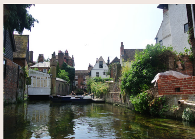
Balade en barque à Canterbury

Départ pour Calais et traversée par la navette Eurotunnel. Route vers Canterbury où vous commencerez par une balade en barque pour découvrir le centre historique de la ville. Puis prome-