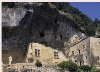
La Roque Saint-Christophe et Villeda

Jour 1 : départ vers la Dordogne et visite de la grotte de Lascaux II puis du parc du Thot à la rencontre de l'homme de Cro Magnon (espace muséographique et parc animalier).