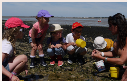
© Ecomusée de Port de Barques

Jour 1 : départ de votre établissement. Arrivée à Rochefort en début d'après-midi et première découverte de la ville avec un rallye jeu sollicitant le sens de l'orientation, de